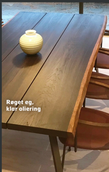
Røget eg, klar oliering