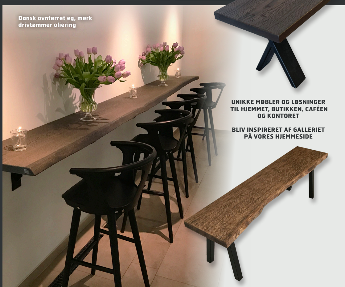
Dansk ovntørret eg, mørk drivtømmer oliering