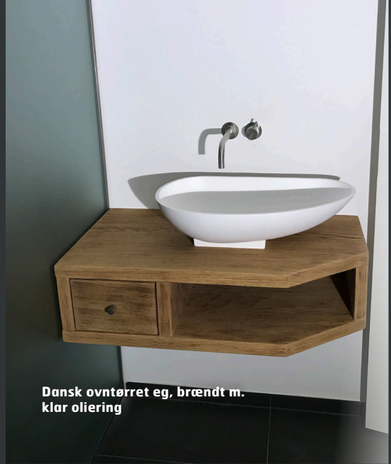
Dansk ovntørret eg, brændt m. klar oliering