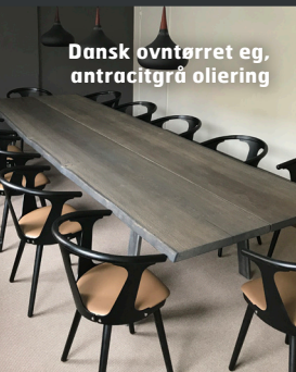
Dansk oventørret eg, antracitgrå oliering