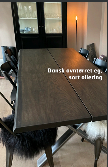
Dansk oventørret eg, sort oliering