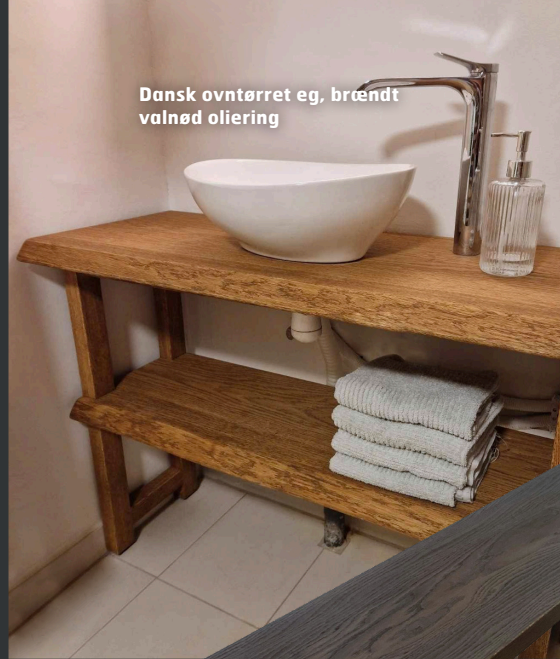
Dansk ovntørret eg, brændt valnød oliering