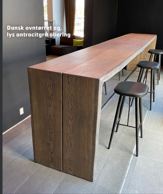
Dansk oventørret eg, lys antracitgrå oliering