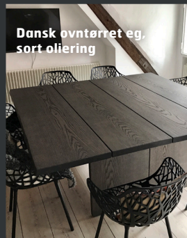
Dansk oventørret eg, sort oliering