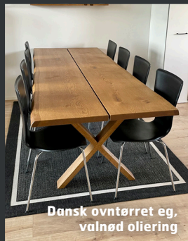
Dansk oventørret eg, valnød oliering