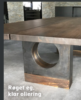
Røget eg, klar oliering