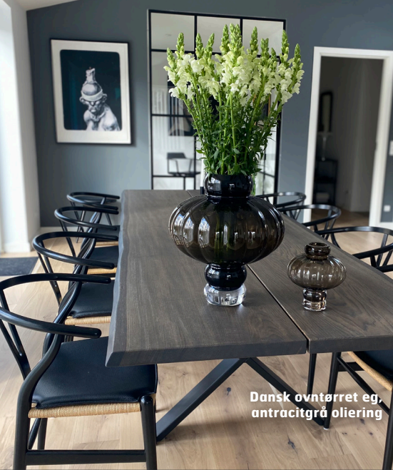
Dansk oventørret eg, antracitgrå oliering