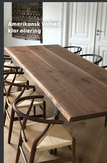
Amerikansk valnød, klar oliering